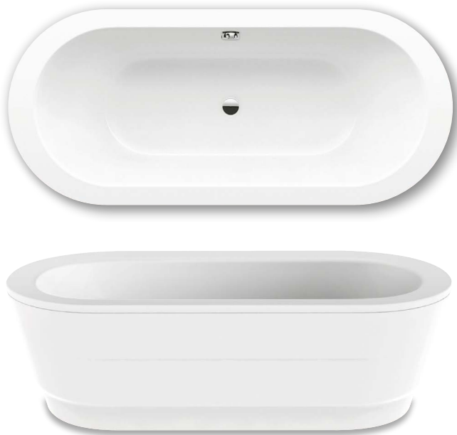
Voorbeeldafbeelding (bestaande uit bekleed speciaal PUR).

Bij bestelling van het bad met enkelzijdige greepgaten de versie xxxx 1011 xxxx bestellen.